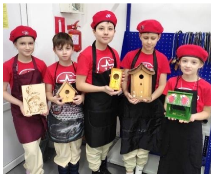
отряд Юнармии г. Новороссийска

Через беседы, познавательные занятия и наблюдения обучающиеся краевого Эколого-биологического Центра узнали о различных видах птиц своего региона, характерные особенности внешнего вида, поведения, научились заботиться о птицах и конечно же, испытали радость от осознания того, что, делая крохами, подкармливая птиц, можно спасти их от гибели.