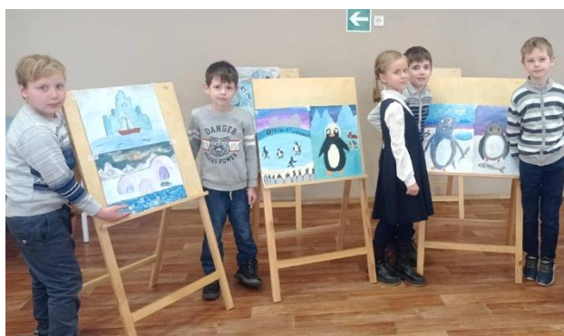
Выставка рисунков объединения «АРТ клуб»

Открытие Антарктиды в 1820 году – одно из выдающихся исторических свершений российских флотоводцев и моряков. 28 января Россия отпраздновала 203 года со дня открытия русскими моряками шестого континента – Антарктиды. Экспедиция под руководством Фаддея Беллинсгаузена и Михаила Лазарева высадилась на ледяной берег самого южного материка.