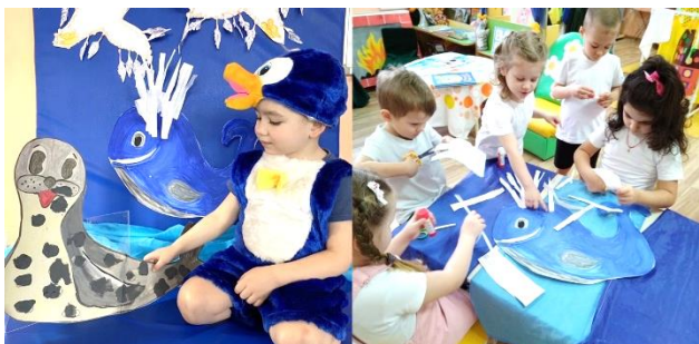
На фото ребята детского сада № 33 «Звёздочка» города Абинск

В акции могут принять участие обучающиеся в возрасте от 6 до 17 лет, а также волонтерские отряды образовательных организаций муниципальных образований Краснодарского края.